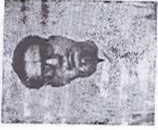
( కుస్త్వీలి సుదర్శనరావు )